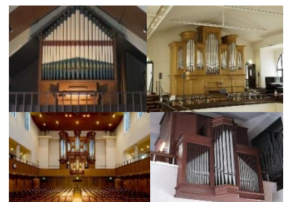
横浜にある8カ所の個性的なパイプオルガンを巡ることができる「パイプオルガンと横浜の街」

日本で初めてパイプオルガンが設置された横浜にある7カ所の個性的なパイプオルガンを聴き比べながら、街の魅力を体感できるコンサートシリーズ「パイプオルガンと横浜の街」や、週末を中心に開催される観覧無料のストリートライブイベント「街に広がる音プロジェクト」も楽しむことができます。